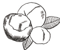
マカデミアナッツ